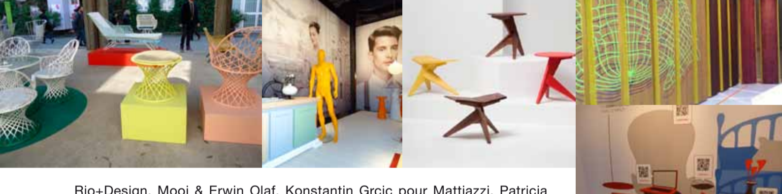
Rio+Design, Mooi & Erwin Olaf, Konstantin Grcic pour Mattiazzi, Patricia Urquiola pour Moroso, eBay House.