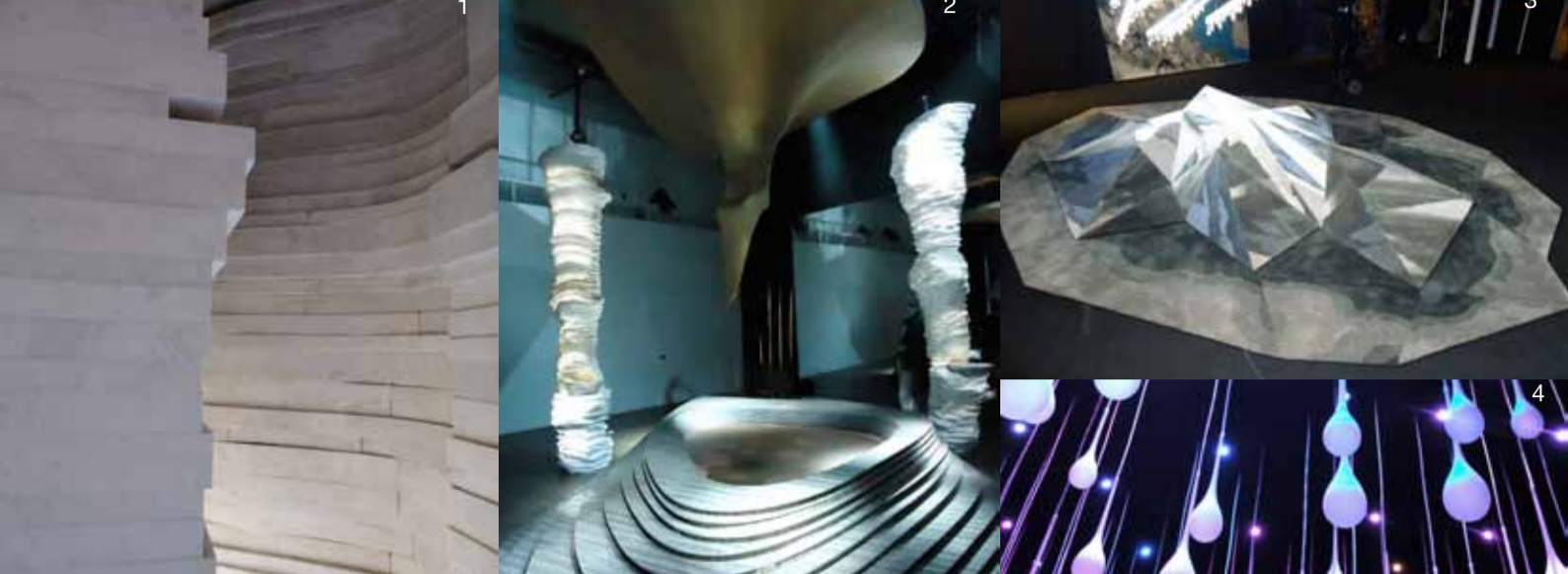
Bathing in Light / « Thus spoke Marble » exhibition. Des créateurs rendent hommage au bamam, lieu de rêve et de culture en utilisant le matériau le plus noble de l'univers du bain, le marbre... Un effet de Canyon par Arik Levy (1). Comme des stalactites : Melogranoblu, drop installation (4) Tsar Carpets shared David Trubridge's (3) Marmo Granido Installation (2)

L'univers de la grotte, matricielle ou féérique, donne vie à des scénographies spectaculaires.