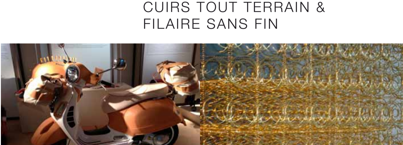
Stefano Conticelli Habillage cuir, Dejana Kabilijo 24carat gold wire, Design Influence à la Triennale, Vico Magistretti par Paolo Ulian.